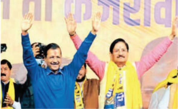
अरविंद केजरीवाल प्रचार करते हुए।